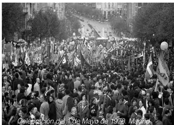
Celebración del 1 de Mayo de 1978. Madrid

Al año siguiente se decidió que el 1º de mayo sería una manifestación anual internacional. Los socialistas españoles analizaron la situación y tomaron la decisión de que, a partir de entonces, la jornada debía ser un día de afirmación plena de la lucha obrera pero no de la revolución social. Habría que organizar actos conmemorativos, siempre con ánimo pacífico. Los anarquistas decidieron que, al no poder realizar la revolución ese día, no tenía mucho sentido la jornada. A mediados de la década de 1890 dejaron de tener interés en el 1º de mayo.