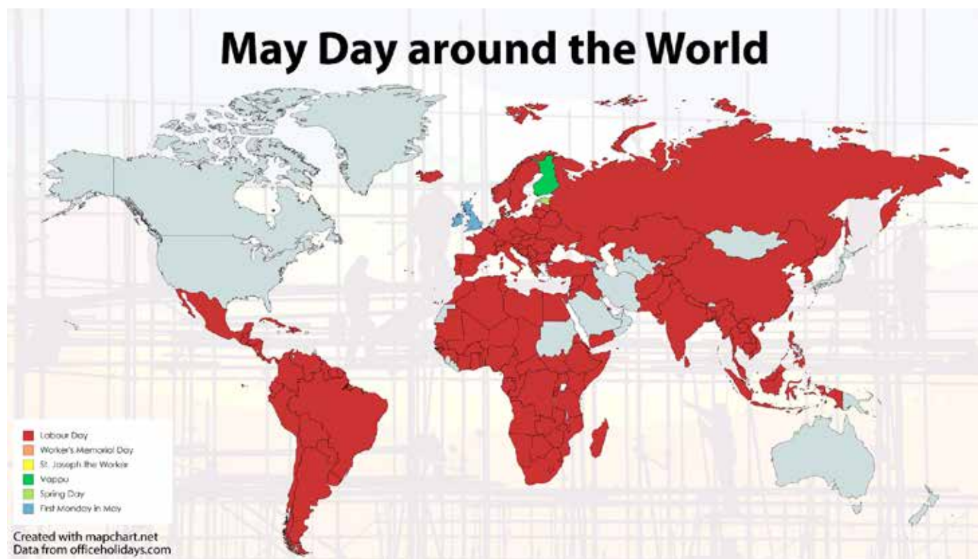
MAPA DE PAISES QUE CELEBRAN EL DÍA DEL TRABAJO EL PRIMERO DE MAYO

Hay países que conmemoran el día del trabajo en otros días, como en Estados Unidos y Canadá, que celebran el Labor Day (Día del Trabajo) el primer lunes de septiembre, y Nueva Zelanda, que lo celebra el cuarto lunes de octubre.